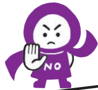
◀ウイングス京都パープルリボン マスコットキャラクター ばーぶるちゃん

パープルリボンは、女性に対するあらゆる暴力をなくすこと、被害にあってはならないことを伝える、自分にできることを考える安全を守ることを目的としています。