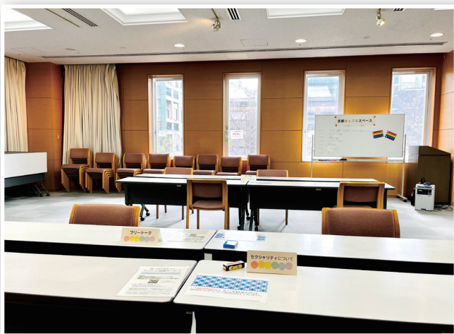
京都まあぶるスペース会場（京都市）