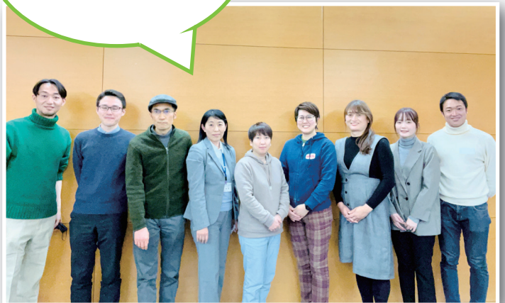
京都まあぶるスペーススタッフ (回によって異なります)